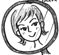
全体のバランスを見る鏡