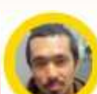
元日本代表の久保選手です